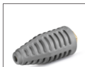
29, 31, 33, 36, 38