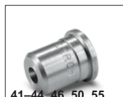
41-44, 46, 50, 55, 57, 59