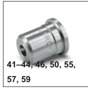
41–44, 46, 50, 55, 57, 59