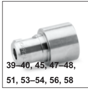
39–40, 45, 47–48, 51, 53–54, 56, 58