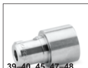
39-40, 45, 47-48, 51, 53-54, 56, 58