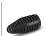
30, 32, 34-35, 37